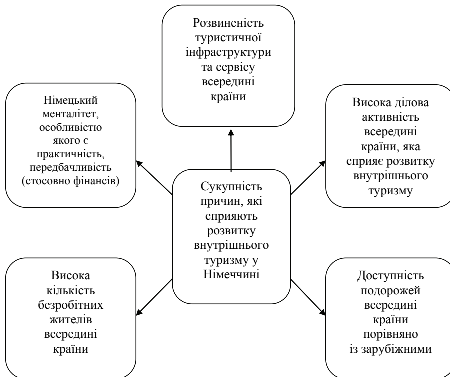
Рис. 2. Сукупність причин, які сприяють розвитку внутрішнього туризму у Німеччині [8].

З визначних пам'яток для туристів буде цікавий замок Бранітц із прилеглим до нього парком, який розташований на півдні міста. Резиденцію побудували на спецзамовлення князя Германа фон Пюклер-Мускау, який був однією з небагатьох ключових фігур країни в XIX ст. Це був письменник, мандрівник і землевласник, а також ландшафтний дизайнер при Прусьському дворі. Споруда була побудована у стилі бароко, а проект до нього приготував архітектор з Дрездена Готфрід Семпер, який спроектував Дрезденську оперу.