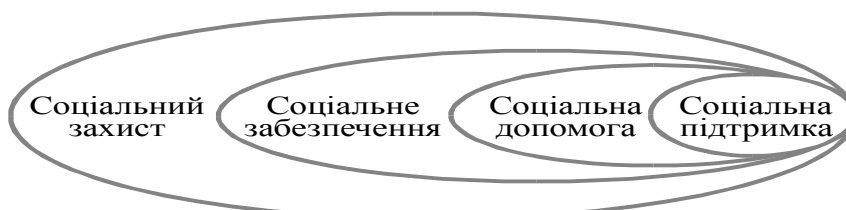
Рис. 1. Співвідношення соціального захисту та його складових [4-7]

Питання про співвідношення соціального захисту та соціального забезпечення було поставлено в економічній науці досить давно, але до теперішнього часу воно не отримало остаточного розв'язання. Мабуть, єдине, що не викликає суперечок, це те, що науковцями [4-7] та ін. було доведено, що поняття «соціальний захист» є всеохоплюючим, найбільш широким, яке містить у собі як соціальне забезпечення, так й інші складові, що схематично можна зобразити співвідношенням, що представлено на рис. 1.