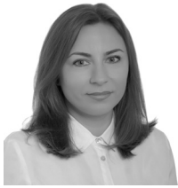
суддя, Печерський районний суд, м. Київ